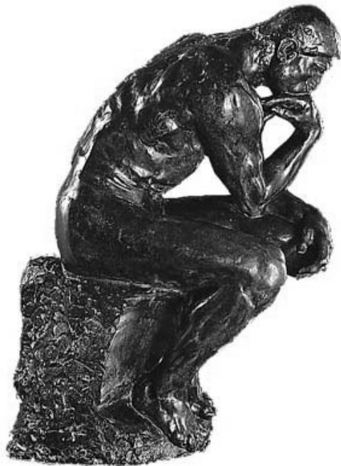
Reproducción de “El pensador” de Rodin.