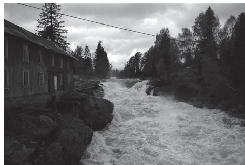
Ommesfoss i Hjartdal kommune (Skiensvassdraget), mai 2010

20 I Noreg har vi observert vassføring i mange elver i fleire tiår. Ei analyse av slike data viser at vårflaumen i Noreg kjem stadig tidlegare. Det er fordi temperaturen har auka og snøsmeltinga startar tidlegare. Sannsynet for dramatiske hendingar vil auke. I områder der den største flaumen i året i dag er ein regnflaum, vil flaumane bli større. Vi venter oss dessutan fleire ekstreme nedbørepisodar med mykje regn på kort tid. Då får vi fleire lokale, store regnflaumar. Små bratte bekker og elver og urbane område vil vere spesielt utsett. Men, det er òg slik at snøsmelteflaumane i dei store vassdraga vil bli mindre, rett og slett av di det blir mindre snø.