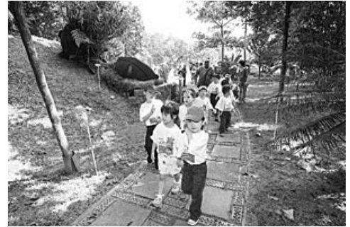
Ibu bapa berperanan mendekatkan anak-anak dengan alam sekitar

5 2 Jika kita terus mengamalkan sikap negatif dalam menjaga alam sekitar, kita sendiri akan menerima padahnya. Buktinya, perubahan cuaca yang tidak menentu, kesan rumah hijau, kenaikan suhu global, pencemaran udara dan air adalah antara kesan buruk yang terpaksa kita tanggung kerana kelalaian kita dalam menjaga alam sekitar.