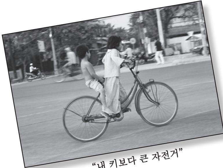
“내 키보다 큰 자전거”

지난 2월 초 캄보디아에서 찍은 사진입니다. 내 키보다 큰 자전거에 누이는 엉덩이도 붙이지 않은 채 하나뿐인 안장은 동생에게 내어주고 힘차게 자전거를 저어 갑니다. 오누이의 정에 마음까지 훈훈해집니다. 이런 사랑이면 힘겨운 세상도 능히 헤쳐나갈 것 같습니다.