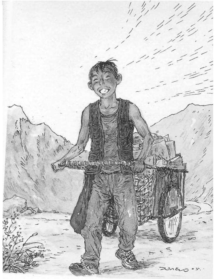
박재동, 자, 가자! 2 (2008)