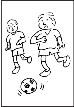
例 川 □