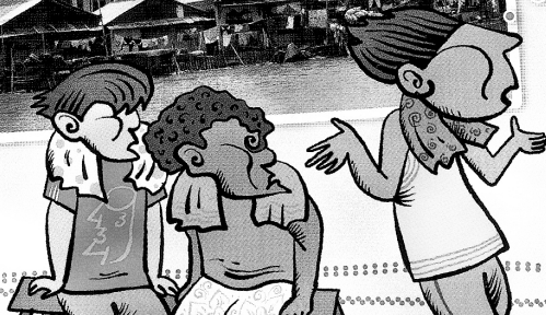
Teks dan gambar: Joko; Foto: Ricky Martin

"Bagiku, tinggal di rusun pun menyenangkan. Tanpa lift, aku justru lebih sehat. Sebab, setiap hari selalu olah raga naik turun tangga. Areal parkir rusun memang sangat terbatas dan tidak ada fasilitas kolam renang. Tapi, biaya keamanan dan kebersihan murah. Biaya listrik dan air bersih juga murah karena sudah ditentukan besarnya oleh pemerintah. Setiap lantai dihuni banyak keluarga. Jadi, aku enggak kesepian."