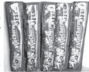
Vitacharm Es, enak dan sehat, lho!