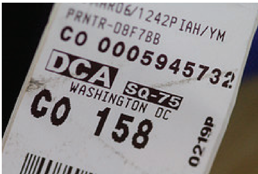
Figura 1: Etiqueta de equipaje