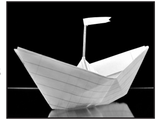
Paper boat: Carlos Porto/ FreeDigitalPhotos.net; http://www.myshutterspace.com/profile/CarlosPorto

In Deutschland werden jährlich 200 Millionen Schulhefte verkauft. Nicht einmal zehn Prozent davon sind aus Recyclingpapier. Mitschuld tragen die verwirrenden Etiketten. So wird „holzfrei weißes Papier“ durchaus aus Holz(-fastern) hergestellt. Tipp: Auf das Zeichen „Blauer Engel“ achten. Dies garantiert, dass das Heft zu 100% aus Altpapier besteht.