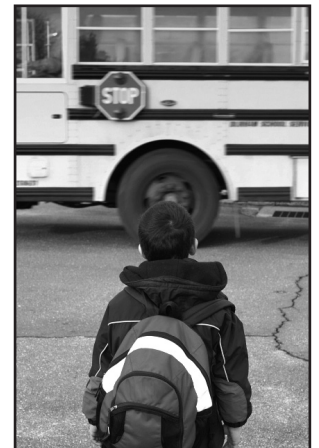
School bus: Arvind Balaraman/FreeDigitalPhotos.net; http://arvindbalaraman.com/