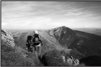
Mountain walking: Michal Marcol / FreeDigitalPhotos.net; http://www.marcol.pl/