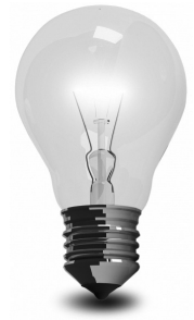
Light bulb: posterize/FreeDigitalPhotos.net; http://www.posterize.com/

Zu viele Schalter im Klassenzimmer für viele einzelne Lampen – und keiner kann sie auseinanderhalten. Die Folge: Auch wenn es nur in einer Ecke dunkel ist, werden aus Bequemlichkeit oft alle Leuchten angeknipst. Beschriftungen für die Schalter bringen Übersicht in den Lichterschungel und helfen auf diese Weise beim Stromsparen.