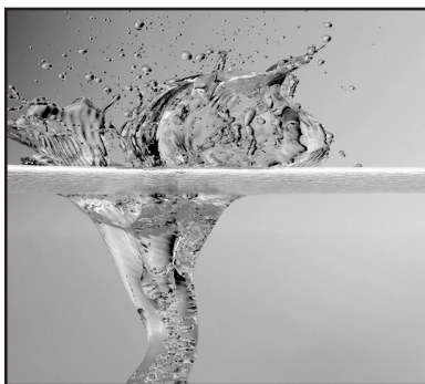
Water splash: Idea Go/FreeDigitalPhotos.net

Dass die Fahrt zur Schule mit dem Fahrrad gesünder und umweltschonender ist als im Auto, weiß jedes Kind. Trotzdem geben nur wenige Schulen Anreize, dauerhaft auf den Drahtesel umzusteigen: zum Beispiel mit einem schön gestalteten und einbruchssicheren Fahrradkeller oder einer betreuten Werkstatt auf dem Schulgelände.