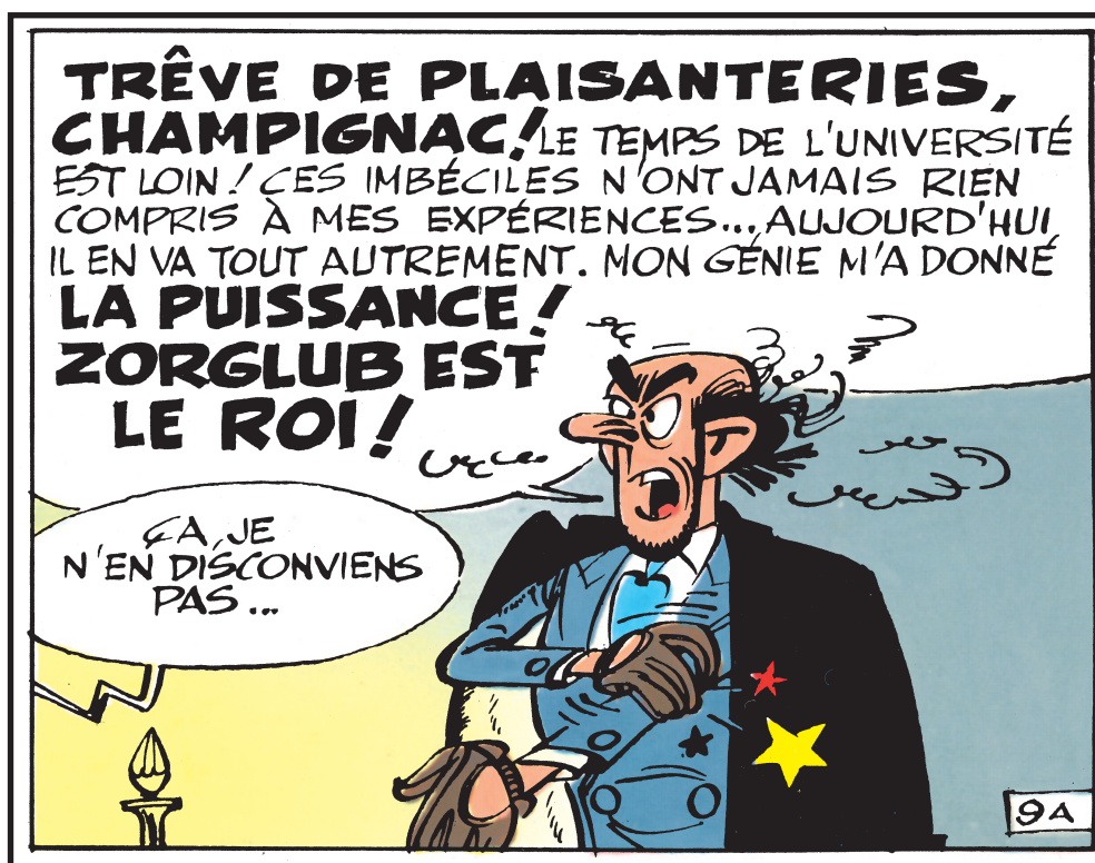
Le lecteur a de la sympathie pour Zorclub, ce savant fou version « soft ». © Franquin/Dupuis/2013.