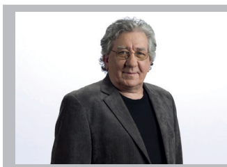
MARIO ROY La Presse

La découverte d'exoplanètes ravive la recherche de vie extraterrestre.