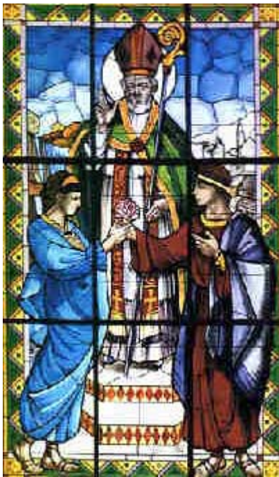
Le prêtre : Saint Valentin

La Saint-Valentin est une jolie coutume qui a plusieurs origines. Valentin était un prêtre qui vivait, il y a très longtemps, sous le règne d'un empereur romain qui interdisait à ses soldats de se marier. Valentin, qui n'acceptait pas cette idée, les mariait en secret. Un jour, malheureusement, l'empereur apprend ce que fait Valentin et condamne ce prêtre à mort. Depuis ce jour, le 14 février, Saint Valentin est le patron des amoureux.