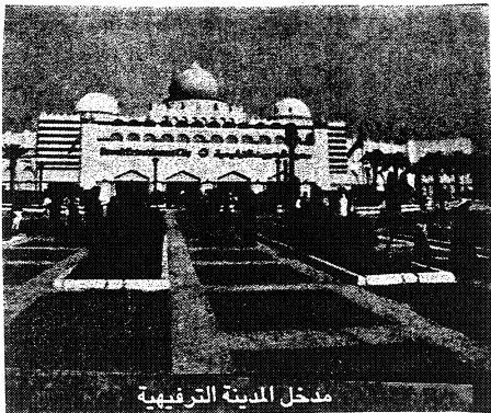
مدخل المدينة الترفيهية

وما أن تنتقل إلى الحديقة حتى يستقبلك مسطح أخضر ومساحات خضراء واسعة وبحيرة هادئة وسطها ولا يخلو الأمر من مسرح وبعض الألعاب الأخرى كلعبة النسر الطائر ولعبة القوارب اللاسلكية. ومن المدينة الترفيهية تنتقل أنشطة العيد على الهواء مباشرة حيث يجتمع هناك الأطفال الذين يوعدون بزيارة للمدينة الترفيهية في العيد أو في مناسبات أخرى.