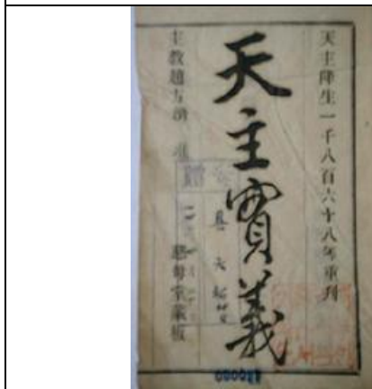
圖三：利瑪竇著述《天主實義》，記載中國士人與耶穌會會士就中西思想討論的對話。其中耶穌會會士引用儒家學說解釋天主教教理。