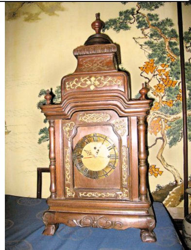
圖二：利瑪竇在中國造的自鳴鐘 (圖中所示為複製品) 利瑪竇進京時曾獻自鳴鐘予明神宗