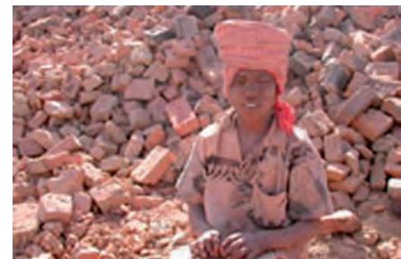
Gwlad dlawd: Nepal