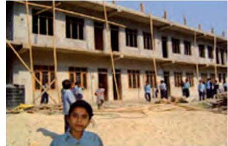
Mae plant Gellifor a Chynwyd wedi codi arian i adeiladu ysgol newydd yn Nepal.

"Mae taith yr athrawon yn enghraifft arall o sut y mae Sir Ddinbych yn datblygu cysylltiadau."