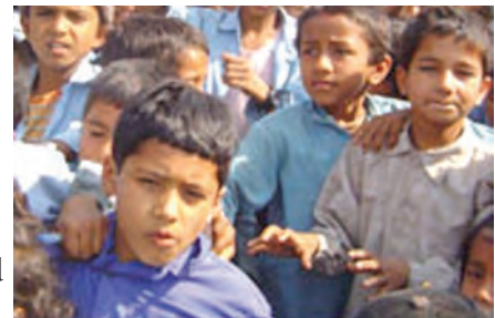
Gobaith y bartneriaeth yw gwella addysg i blant mewn rhannau tlawd o Nepal.