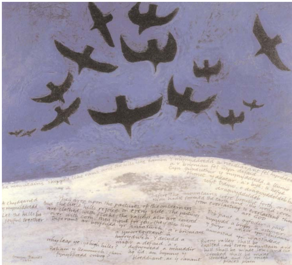
'Gwyngoed, Cigfrain a Dyfyniadau', Ogwyn Davies

Rydym yn ddiolchgar iawn i'r arlunydd Ogwyn Davies am ei ganiatâd i atgynhyrchu ei waith.