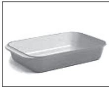
Mias oighinn cheirmeach