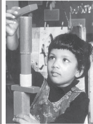
Plentyn 4-5 mlwydd oed