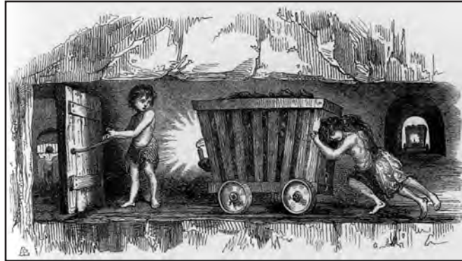
[Plant yn gweithio dan ddaear yn 1842]

(a) Beth mae'r darlun hwn yn ei ddangos i chi am amodau gwaith ar ganol y bedwaredd ganrif ar bymtheg? [2]