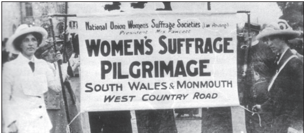
[Cefnogwyr Undeb Cenedlaethol y Cymdeithasau Rhyddfrefinio Merched (NUWSS) yn Ne Cymru yn 1907]

(a) Defnyddiwch Ffynhonnell A, a'r hyn rydych chi'n ei wybod, i ddisgrifio gweithgareddau Undeb Cenedlaethol y Cymdeithasau Rhyddfrefinio Merched (NUWSS). [3]