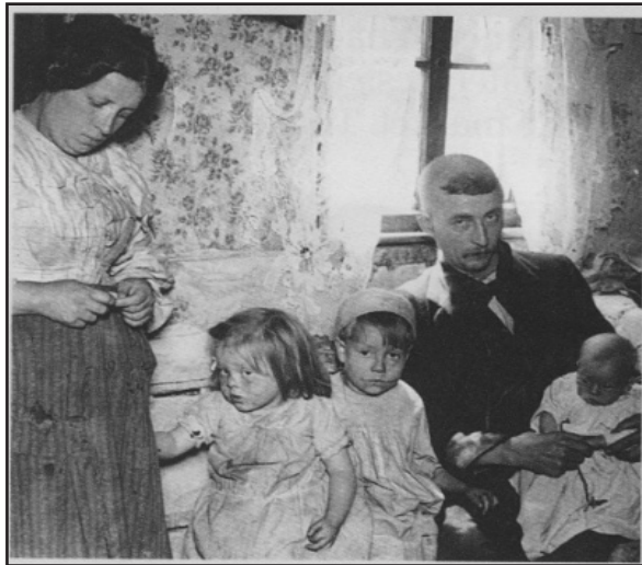
[Ffotograff o deulu tlawd yn 1912]