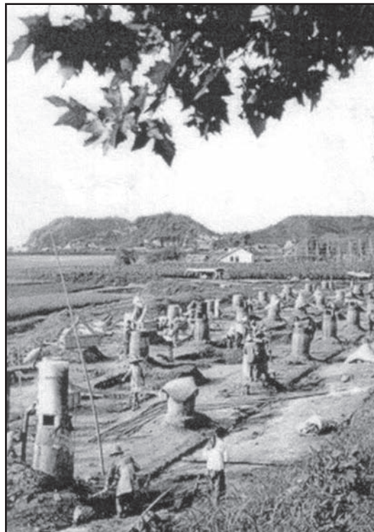
[Pentrefwyr yn Tsieina yn gweithio wrth eu ffwrneisi chwyth eu hunain fel rhan o'r Naid Fawr Ymlaen]