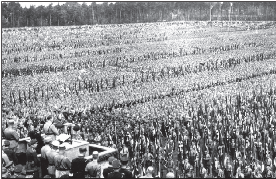
[Hitler yn annerch aelodau o'r Blaid Natsïaidd mewn rali fawr yn Hamburg yn 1932]