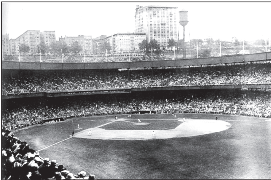
[Chwarae gêm pêl fas mewn stadiwm yn Efrog Newydd yn ystod y 1920au.]

(a) Defnyddiwch Ffynhonnell A, a'r hyn rydych chi'n ei wybod, i ddisgrifio pam y daeth chwaraeon mor boblogaidd yn ystod y cyfnod hwn. [3]