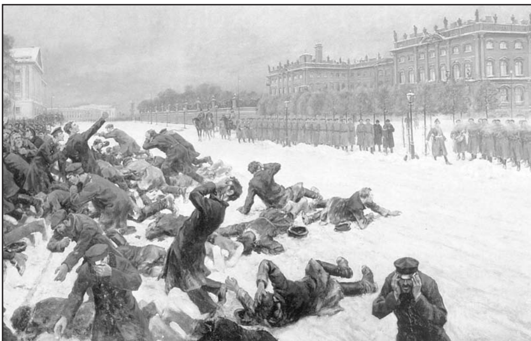
[Paentiad o ddigwyddiadau Sul y Gwaed]

(a) Defnyddiwch Ffynhonnell A, a’r hyn rydych chi’n ei wybod, i ddisgrifio digwyddiadau Sul y Gwaed. [3]