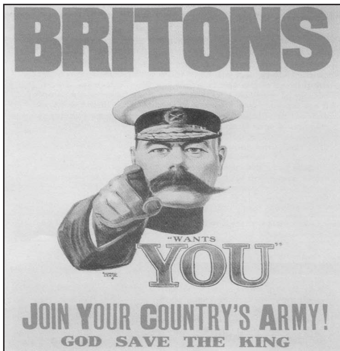
[Poster recriwtio yn annog dynion i ymuno â'r fyddin yn 1914]

(a) Defnyddiwch Ffynhonnell A, a'r hyn rydych chi'n ei wybod, i ddisgrifio ymgrych recriwtio'r llywodraeth ar ddechrau'r Rhyfel Byd Cyntaf. [3]