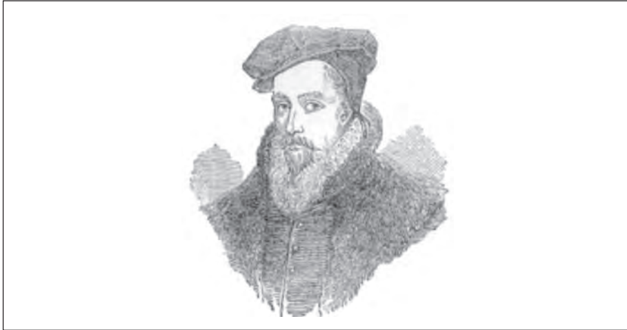
[Mae'r darlun yn dangos William Cecil (Yr Arglwydd Burghley), gŵr llys a gwleidydd pwysig o oes Elisabeth]

Astudiwch y ffynhonnell isod ac yna atebwch y cwestiynau sy'n dilyn.