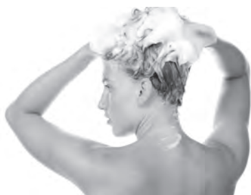
someone washing their hair