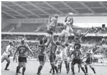
people playing rugby