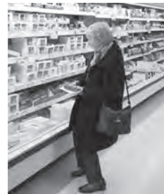
someone in a supermarket