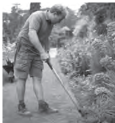
a man gardening