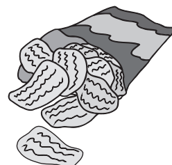
a packet of crisps