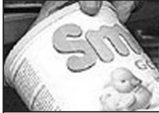
Llaeth Powdwr Babi

Mae'r siart isod ar duniau llaeth powdwr babi.