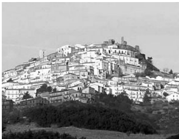
Un'immagine di Colobrarò

Il mio giornale mi manda in Basilicata per capire il fascino del paese che porta sfortuna. «Scusi: per Colobrarò?». Chiedi un'indicazione e t'infili in una processione di scongiuri superstiziosi. Dita che toccano ferro, si trasformano in corna, frugano scaramantiche nelle tasche. L'ignaro – chiamando il paesino col suo nome – non sa cosa rischia: «Stia attento mentre guida... – dice un ragazzo di Pisticci –, e mi raccomando: non lo nomini». «Cosa non dovrei nominare?». «Quel paese. E' meglio: non si sa mai». Ecco fatto. Pur di non nominarlo, da queste parti, lo chiamano così: «Quel paese».