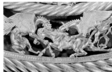
Частина нижнього ярусу