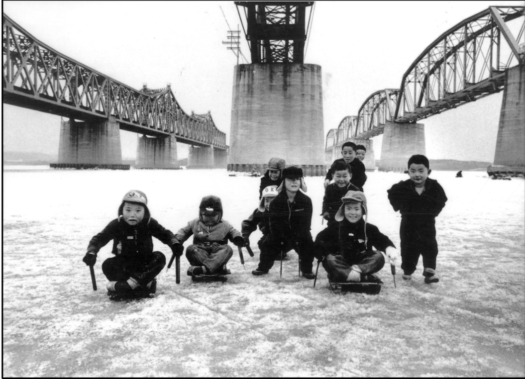
1956년 한강: 한겨울, 뽕뽕한 한강에 모여든 아이들의 정겨운 한때

아래 광고를 통해서 회사는 어떠한 효과를 얻으려 했을까요? 광고의 그림과 문안을 잘 보고 70 단어 정도로 당신의 의견을 쓰시오.