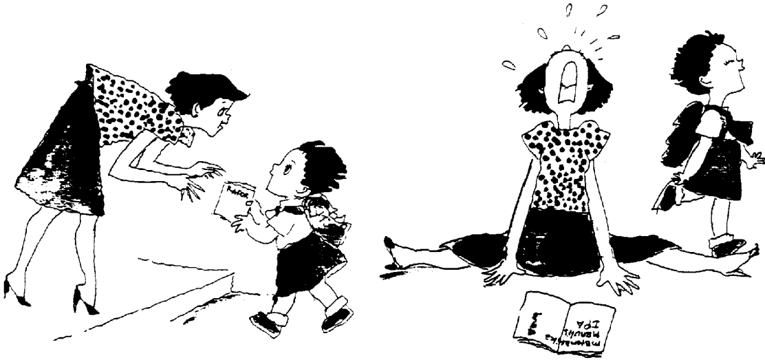
Cara membantu anak Anda membaca