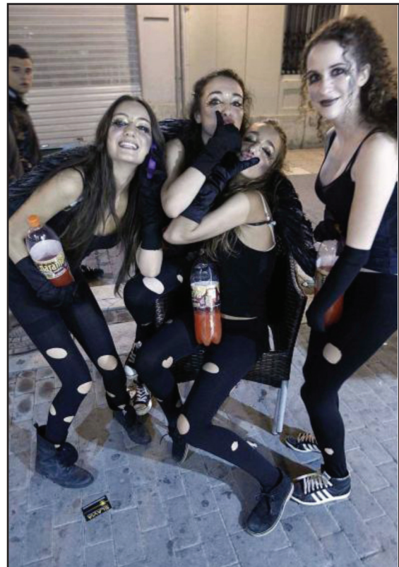
Unas jóvenes disfrazadas para celebrar Halloween

Pero si la noche fue intensa para la policía, más lo fue para los servicios de limpieza. Los operarios tuvieron que retirar ocho toneladas de residuos. Hacia la una del mediodía y después de un gran esfuerzo, los operarios lograron retirar la basura acumulada. Un portavoz del Ayuntamiento criticó a la juventud. “Los jóvenes suelen beber sin moderación y tiran los residuos sin importarles la suciedad que dejan.” (v) La limpieza ha supuesto un gasto económico que superará los 230.000 euros.