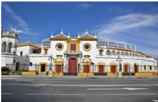
Plaza de toros, Sevilla

“La tauromaquia es algo más que un espectáculo público: forma parte de la identidad y cultura de Andalucía.”