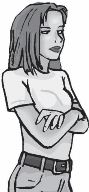
la madre soltera