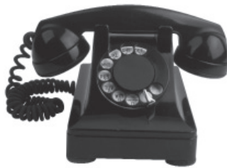
1950 – el teléfono fijo, sólo transmite sonido