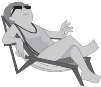
Paco pasará todo el día tomando el sol