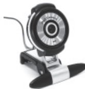
2010 – webcam, transmite imágenes en vivo