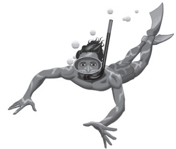
Carlos practicará los deportes acuáticos