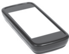
2005 – el teléfono móvil con juegos, cámara, Internet, vídeo...