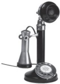
1920 – el teléfono antiguo, un aparato de lujo