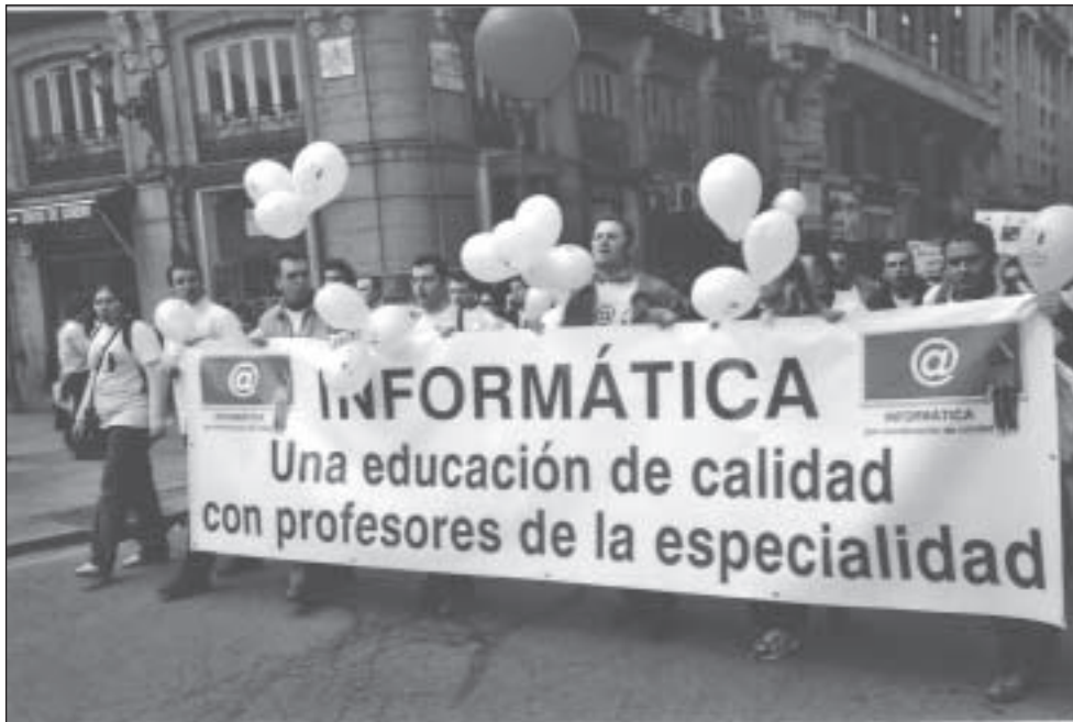
Padres, profesores y estudiantes se manifiestan en Madrid por una mejor educación