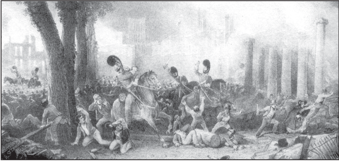
[Paentiad o'r cyfnod o derfysgoedd Bryste (1831)]