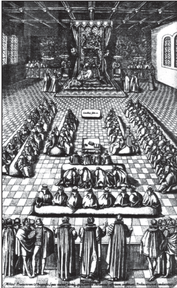
[O lun o'r cyfnod yn dangos Agoriad Swyddogol y Senedd (1563)]