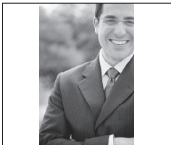
Cem Özdemir, 35, Politiker

Als ich vor zwei Jahren von Bonn nach Berlin zog, wollten meine Freunde und Verwandten bei mir übernachten, um sich die Hauptstadt anzuschauen. Oft komme ich nicht vor elf Uhr nachts aus dem Büro, finde aber immer noch einen kleinen Laden, wo ich als Vegetarier das nötige frische Obst und Gemüse kaufen kann.