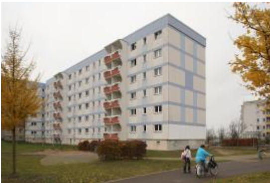
Ein Flüchtlingsheim in Bayern