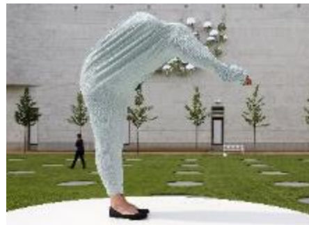
2012: moderner, unterirdischer Erweiterungsbau