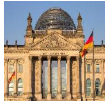
Reichstag – politisches Zentrum Deutschlands; offen für Besucher