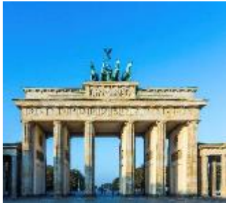
Brandenburger Tor – Symbol der Teilung und Wiedervereinigung Deutschlands

Die 5 beliebtesten Berliner Sehenswürdigkeiten: