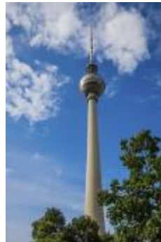
Fernsehturm – höchstes Gebäude Deutschlands; Berlin von oben sehen