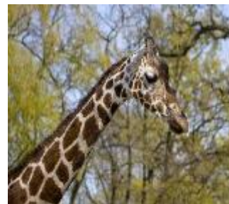
Berliner Zoo – ältester Zoo Deutschlands