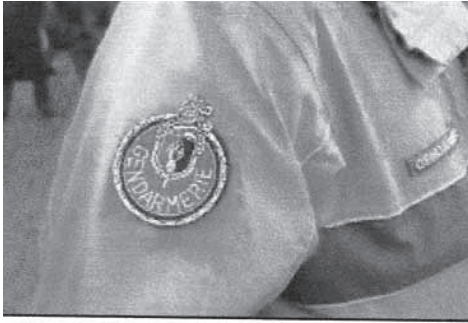
Un uniforme de gendarme

1er décembre 2006 : Isabelle Guion de Méritens est devenue le premier officier de gendarmerie française promu au grade de Colonel, après avoir été, en 1987, le premier officier féminin recruté par la gendarmerie nationale.