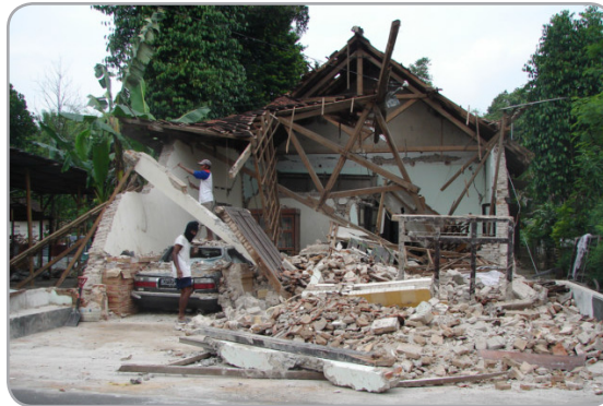
Ayuda a las víctimas del terremoto

La mayoría de las víctimas y de los daños del reciente desastre se registraron en la ciudad de Dos Arroyos. Afortunadamente se usó un puente aéreo para evacuar a decenas de habitantes afectados a la capital. Al mismo tiempo, prosigue una campaña para recaudar donaciones de víveres y prendas de vestir para las víctimas. También se inició una campaña de donaciones de sangre para los heridos.