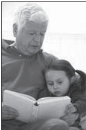
Hilfe bei der Kinderbetreuung

Eltern, Kinder, Großeltern oder ältere Verwandte – das Zusammenleben in der 'Großfamilie' wird wieder beliebter.