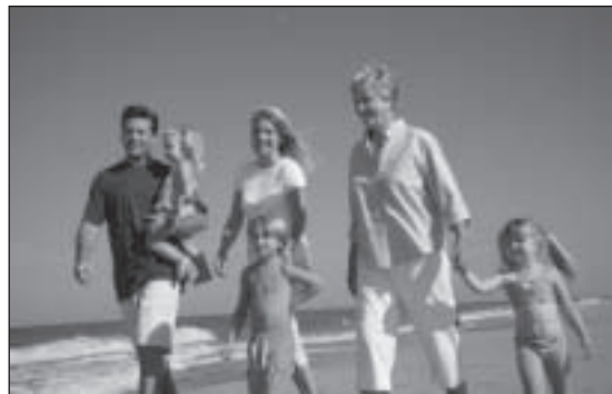
Im Alter nicht allein sein