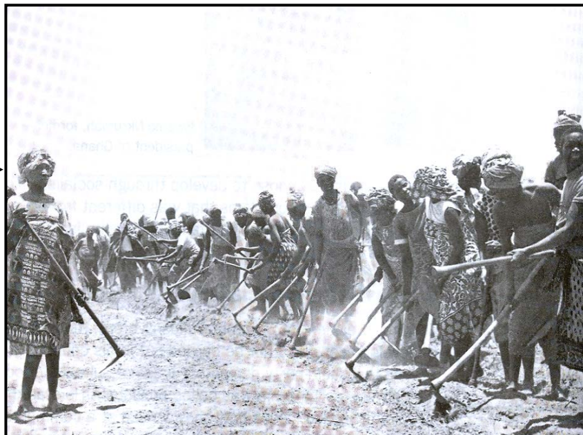
Koöperatiewe boerdery (ujamaa)

Nyerere se visie van 'n toekomstige Tanzanië was dié van 'n vooruitstrewende, selfstandige en klaslose samelewing. Hy het dit 'Afrika-sosialisme' genoem ... Sosialisme in Tanzanië moes gebaseer wees op plaaslike hulpbronne eerder as ingevoerde, hoëtegnologie-industrialisasie. Die land se grootste banke en kapitalistiese maatskappye in buitelandse besit sou genasionaliseer word, dit wil sê, deur die staat oorgeneem word in belang van die mense. 'n Kode vir Leiers het politieke leiers verbied om private rykdom te vergader. Die hoofklem van die regering moes op landelike ontwikkeling wees wat tot selfstandigheid sou lei.